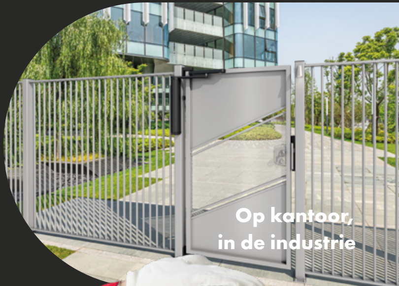
Op kantoor, in de industrie